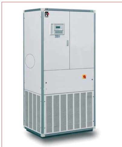
■ Кондиционер ENERTEL с раздачей воздуха через переднюю панель

симости от условий работы величина энергосбережения может составлять от 10 до 40 кВт в сутки для одной базовой станции.