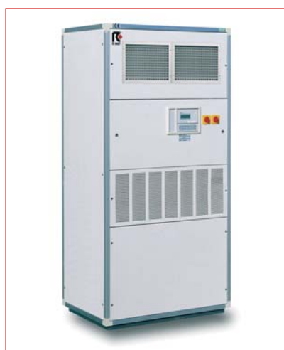
■ Кондиционер ENERTEL с раздачей воздуха вверх

Б урное развитие рынка сотовой связи создает устойчивую тенденцию к увеличению количества базовых станций, мощностей установленного в них оборудования, и, как следствие, к увеличению теплопритоков от этого оборудования в процессе работы. Все это создает условия для более широкого применения специализированных кондиционеров, предназначенных для базовых станций сотовой связи. Эти кондиционеры выгодно отличаются от моделей бытовой гаммы в плане функциональных особенностей, надежности, а также наличием дополнительных возможностей. Необходимость использования подобных кондиционеров обусловлена повышенными требованиями к системам кондиционирования базовых станций, поскольку данные системы должны работать 24 часа в сутки, 365 дней в году, поддерживать температурный режим в помещении с заданной точностью, обеспечивать бесперебойную работу даже в случае отключения электропитания. Именно для ре-